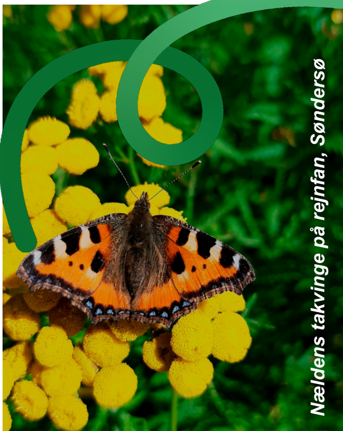
Nældens takvinge på rejnfan, Sønder sø

Men en art som okkergul pletvinge lægger sine æg på forskellige arter af vejbred, som har det svært i konkurrencen med brændenælder, græsser med videre. Bl.a. derfor går okkergul pletvinge hastigt tilbage, mens nældens takvinge klarer sig udmærket.