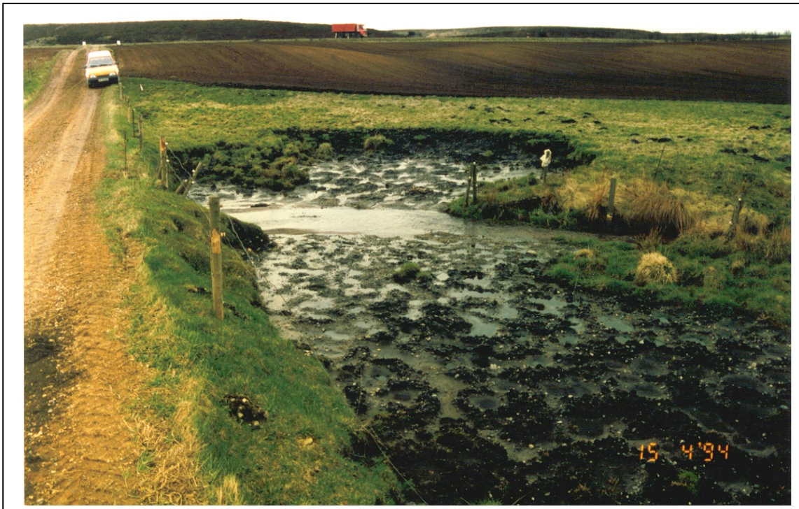
Figur 14. Viser hvor store mængder materiale, der er borteroderet i forbindelse med en kreaturovergang.

Et uhensigtsmæssigt vadested er en passage over et vandløb, hvor vandløbsbrinkerne ikke er beskyttet imod nedtrædning med deraf følgende borterrosion af brinkmateriale, til skade for vandløbets plante- og dyreliv.