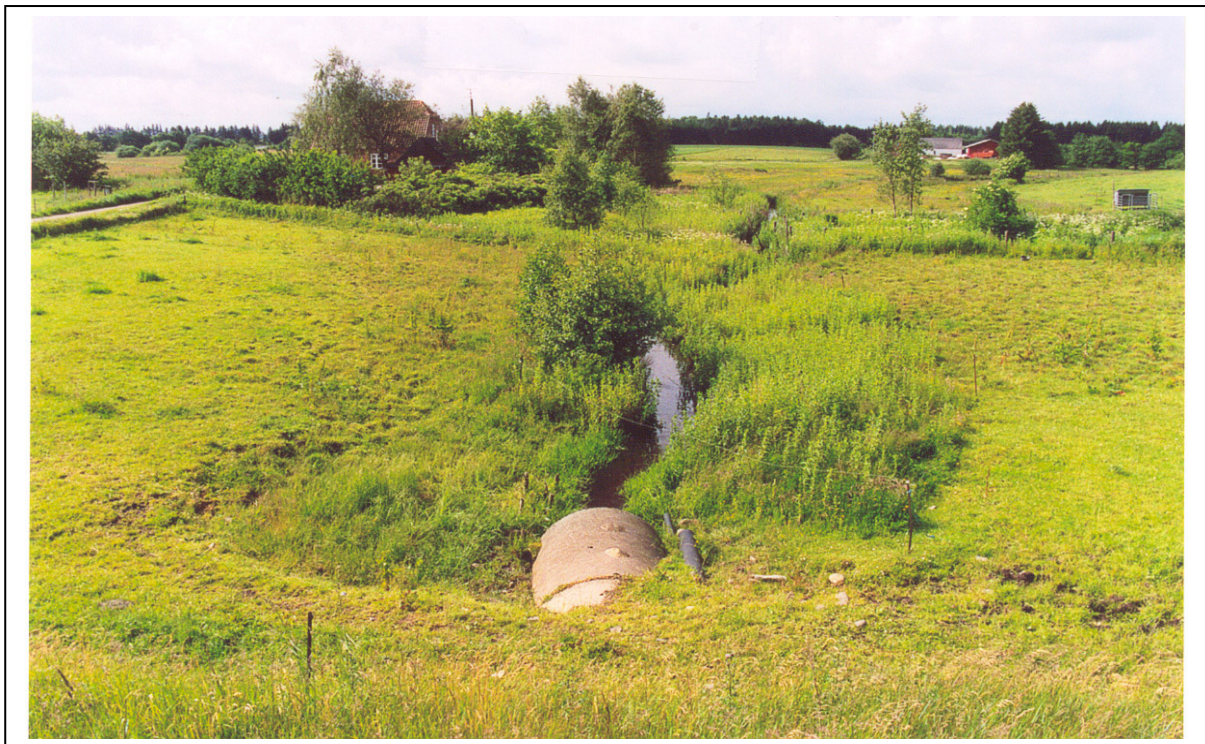
Figur 3. Samme vandløbsstrækning som i fig. 1 og 2 efter 8 års hegning.