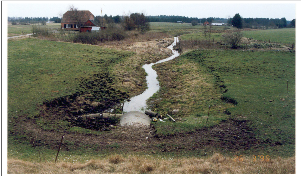
Figur 2. Samme vandløbsstrækning som i fig. 1, 4 år efter at der er foretaget en afhegning, bemærk indsnævringen af vandløbsprofilen.