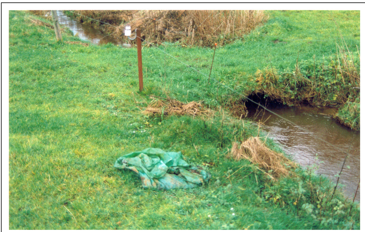
Figur 16. En velanlagt passage over et vandløb, bemærk den høje vandstand i røret som sikre en tilfredsstillende passage af smådyr og fisk.

Afhængig af vandløbets størrelse er den mest hensigtsmæssige udførelse af et vadested en bro eller et nedgravet cementrør. Vær opmærksom på, at få gravet cementrøret godt ned i vandløbsbunden en tommelfingerregel er, at 1/3 af rørets diameter skal være nedgravet. På denne måde virker røret ikke som nogen spærring for op- og nedstrøms passagen af smådyr og fisk. Røret skal endvidere være så stort, at det kan føre vandløbets maksimalvandføring.