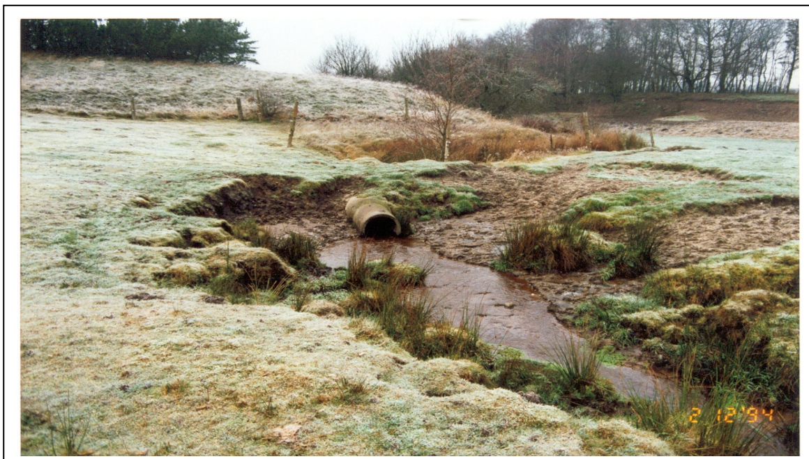
Figur 9. Her har erosion som følge af kreaturerne færd medført et bredt vandløb med lavere vandstand i forhold til røret, på denne måde er der her blevet skabt en selektiv spærring.

Det mest hensigtsmæssigt indrettede vandingssted får man ved at anvende en mulepumpe, en vinddreven vandpumpe eller lign.