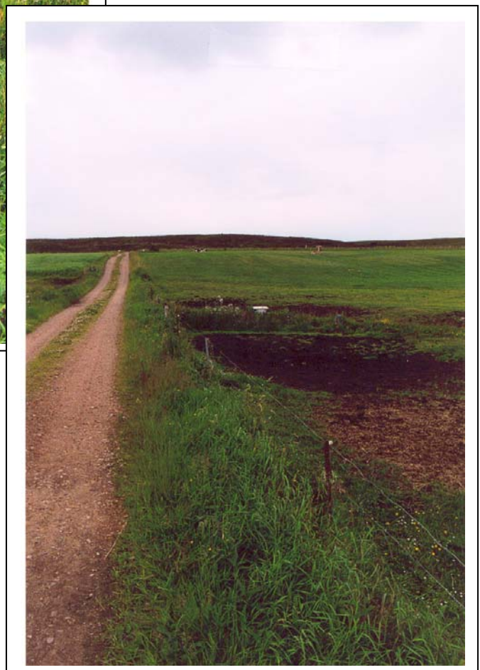
Figur 15. Samme vandløbslokalitet som i figur 14. Efter etablering af afhegning har vandløbet retableret sig ganske smukt, nærbillede af lokaliteten ses i fig.15a.