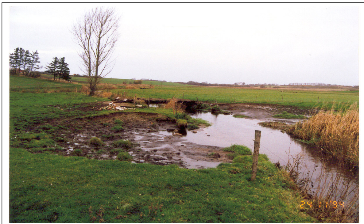
Figur 5. To uhensigtsmæssige vandingsteder overfor hinanden i et mellemstort vandløb, bemærk de mange kubikmeter bortroderet jord, "timeglasformet" vandingsted.

De til tider store blotlagte flader ved vade-/vandingsteder er steder, hvor vandløbet eroderer store mængder sand og jord bort. Dette skaber et forøget behov for oprensning af vandløbet og deraf følgende større udgifter for vandløbsmyndigheden. Endvidere er disse ofte fugtige flader yderste favorable levesteder for nogle små insekter kaldet mitter, som er bittesmå myg, som stikker både dyr og mennesker.